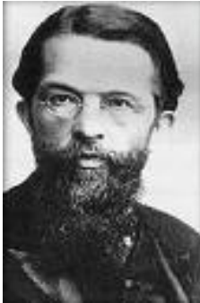
Carl Menger (Austria, 1840-1921)