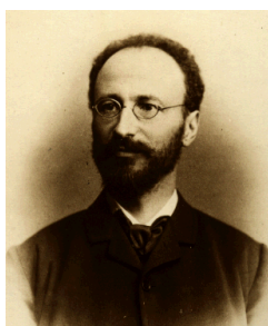
Eugen von Böhm-Bawerk (Austria, 1851-1914) Kapital und Kapitalzins: Positive Theorie des Kapitals (1889)