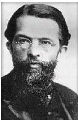
Carl Menger (Austria, 1840-1921)

Instituciones: esquemas pautados de comportamiento que adoptan los seres humanos para conseguir mejor sus objetivos individuales. Surgen de forma evolutiva y consuetudinaria de las aportaciones de innumerables seres humanos durante grandes periodos de tiempo.