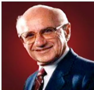
Milton Friedman (EEUU, 1912-2006)

Las organizaciones económicas tienen una doble función en la promoción de una sociedad libre. Por una parte, la libertad en las organizaciones económicas es en sí una parte de la libertad en términos generales, así que la libertad económica es un fin en sí misma. En segundo lugar, es también un medio indispensable para la consecución de la libertad política .