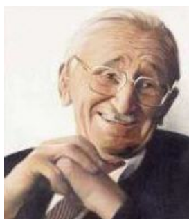
Friedrich August von Hayek (Austria, 1899-1992)

La igualdad ante la LEY (la única igualdad justa) predomina sobre la lealtad y da lugar a la sociedad abierta , donde todos cooperamos de forma espontánea con todos los demás.