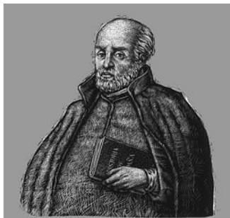
Juan de Mariana (España, 1536-1624) Historia de España: De rebus hispaniae (1592)

Las ansias de poder de Filipo de Macedonia y Alejandro Magno acabaron con la libertad en el mundo de las ciudades-estado griegas.