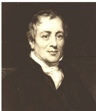
Ley de asociación de David Ricardo (Inglaterra, 1772-1823)